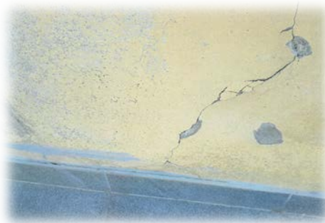
Vrtec na Ponikvi