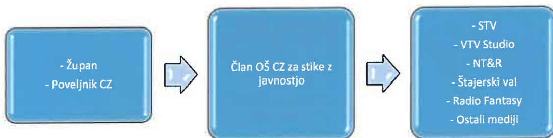
Slika 2: Obveščanje javnosti

Za obveščanje javnosti o izvajanju nalog zaščite, reševanja in pomoči iz občinske pristojnosti je odgovoren poveljnik CZ občine Žalec in župan, v skladu s svojimi pristojnostmi, oziroma član štaba, ki je zadolžen za stike z javnostjo.