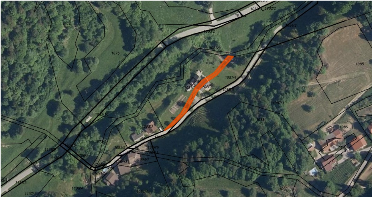
Prikaz zemljišča parc. št. 1919/7 k.o. 977 – Železno: