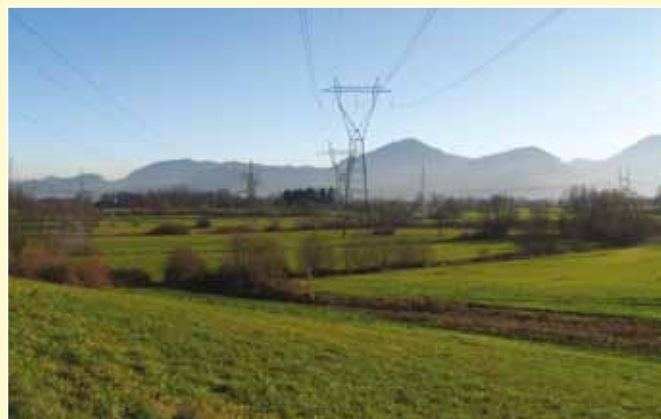
Mokrotni travniki z mejicami

Obrežja rek, kanalov in jarkov poraščajo predvsem grmovni sestoji. Izjemen krajinski videz območja dopolnjujejo mejice, ki predstavljajo ločnico med različnimi rabami prostora in skupaj s travniki in njivami prispevajo k večji biotski pestrosti. V prostoru mejice niso nikoli imele velikega gospodarskega pomena, imajo pa zato velik naravovarstveni in krajinski pomen. Tukaj najdemo zatočišče številne živalske in rastlinske vrste, ki bi drugače težko preživele.