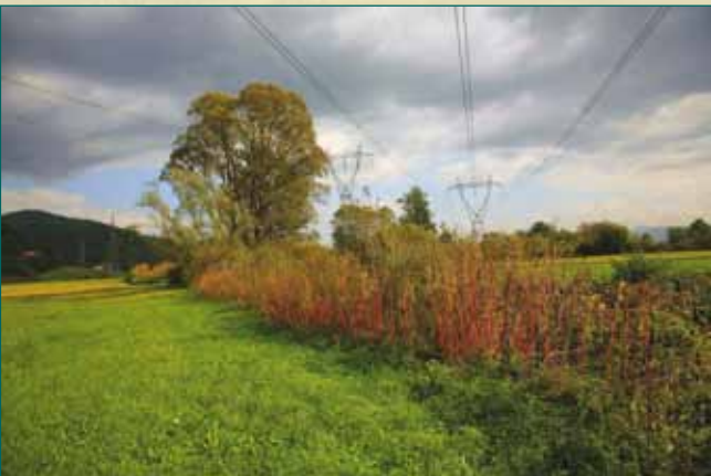
Visoka vegetacija ob potoku